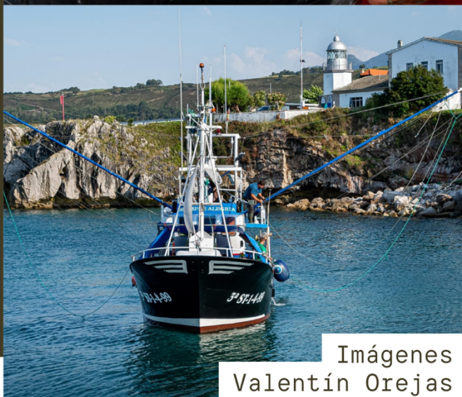
Imágenes Valentín Orejas